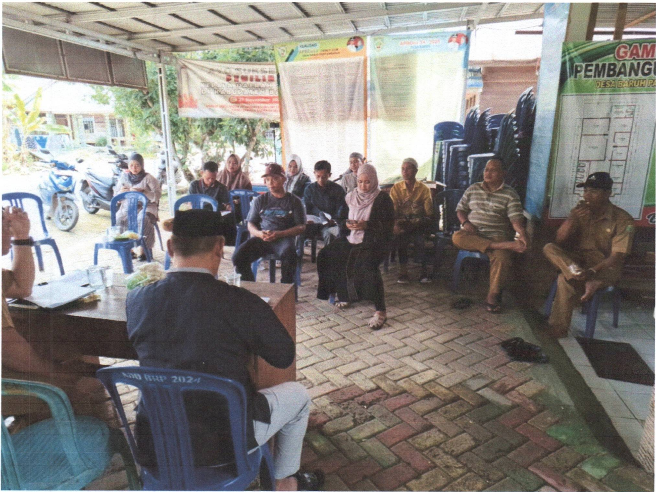
Foto – Foto Kegiatan